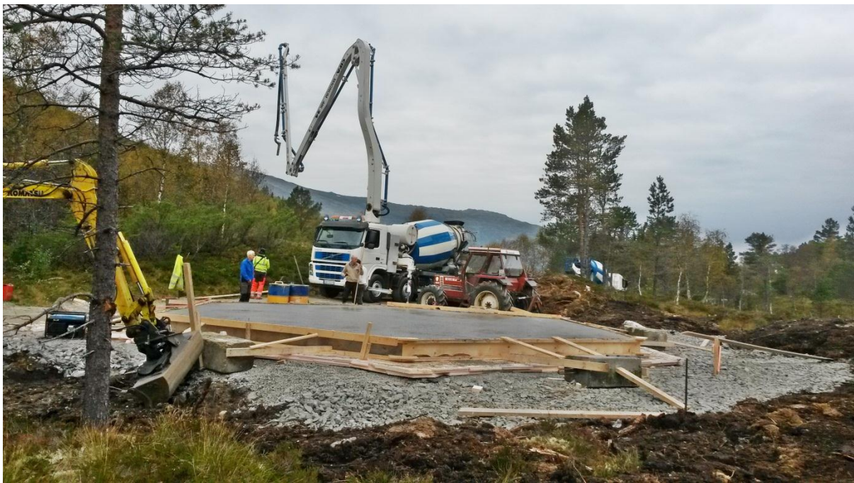
Gimmestad/Moen Sameige støyper fundament i Langedalen september 2014.